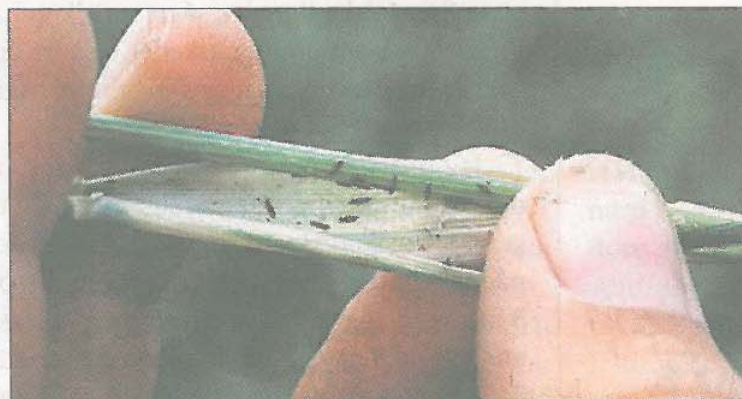
Trips i triticale.

- Anvend omkring 200 l vand, og sprøjt om morgenen. Tripsene kan også gøre skade senere, men så er det rent sprøjteteknisk ikke muligt at ramme dem, oplyser videncentret.